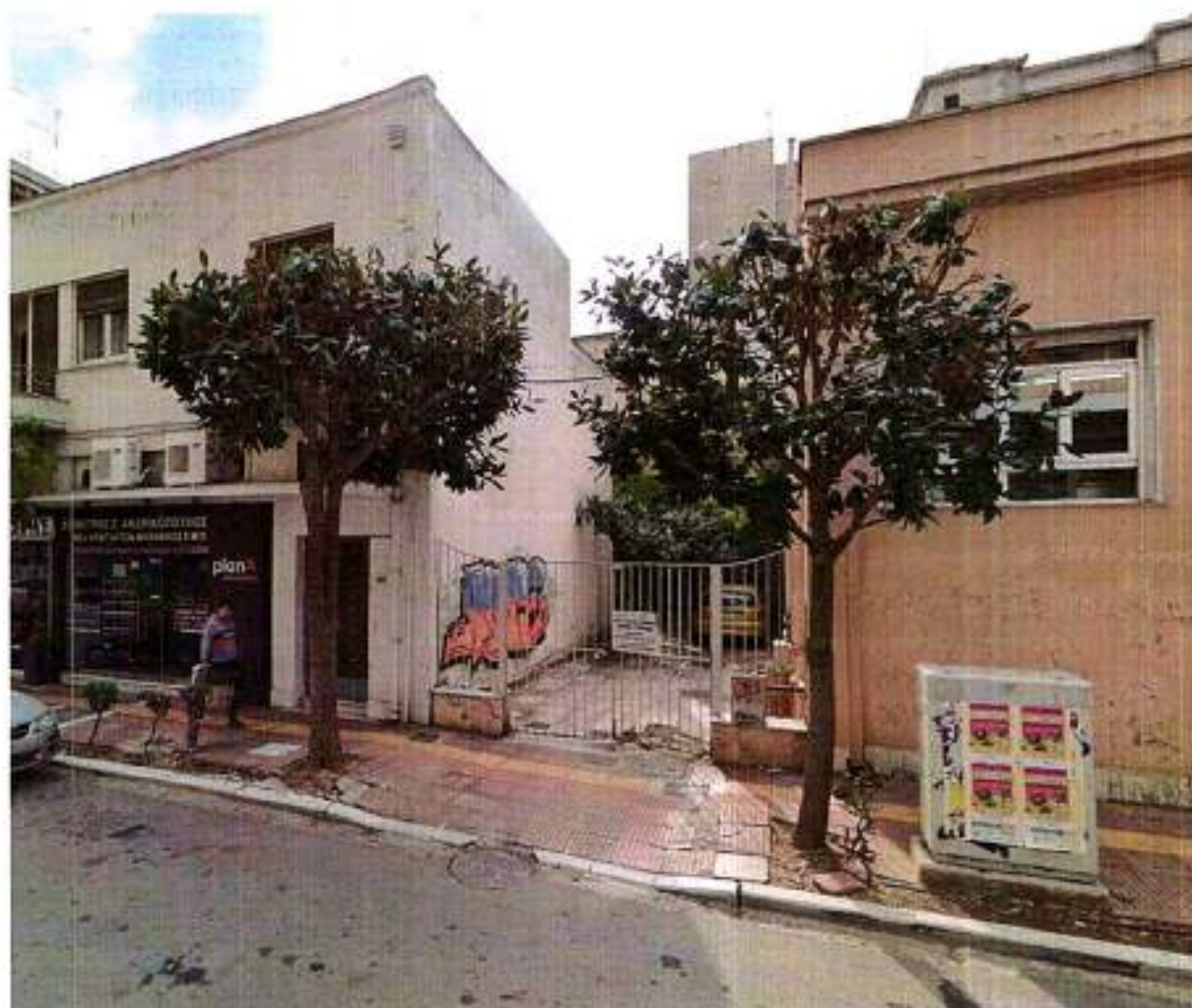
Σημείο 1: Δημητριάδος 182, έμπροσθεν parking Χημείου του Κράτους (δύο δέντρα).