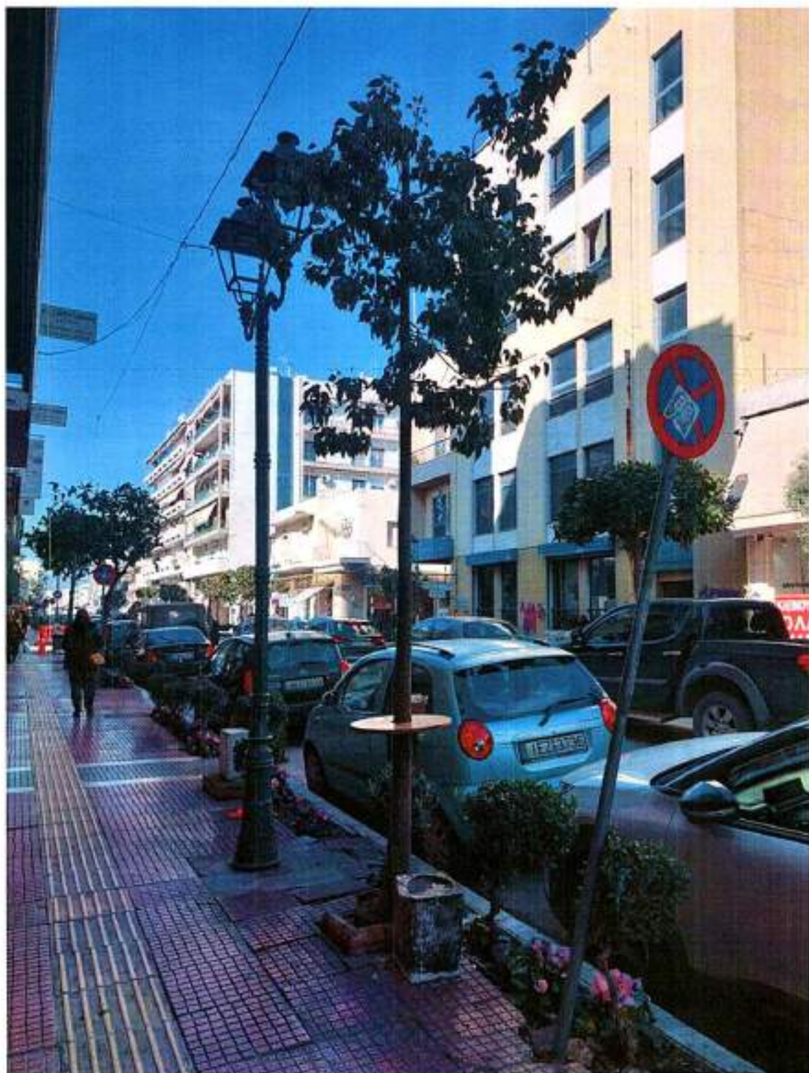
Σημείο 2: Δημητριάδος 154, με Γκλαβάνη (ένα δέντρο).