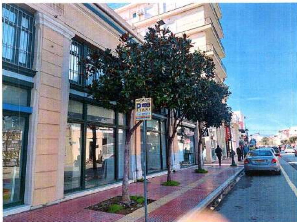
Σημείο 4: Δημητριάδος 52 (τρία δέντρα).